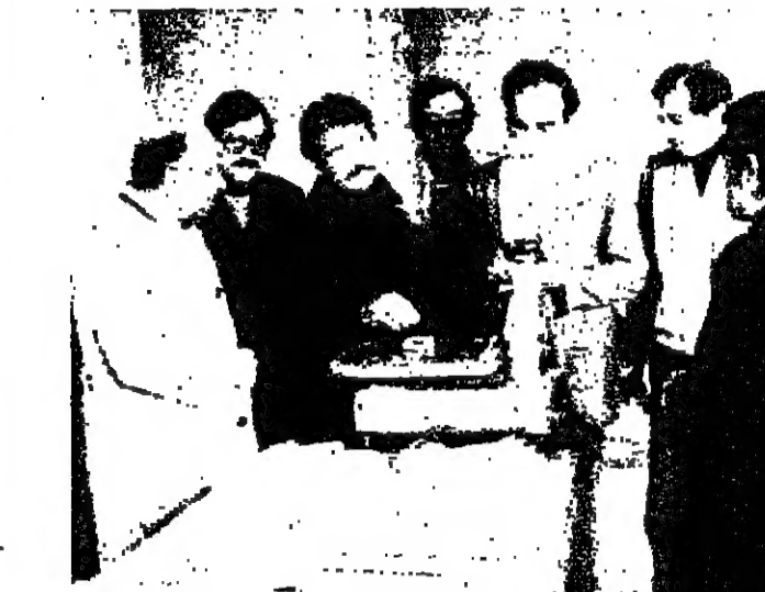
عملية وزن الطرود والرسائل

ان يأتي الى مركز البريد ويبيده رسالة مفتوحة . تاليا : يتم اقبال الرسالة بحضور موظف البريد وتحت اشرافه ، دون ان يكون له حق الاطلاع عليها . أو قرأتها ثم تلصق عليها التمغة البريدية وتغتم بحضور صاحبها . واقبلت الرسائل مفتوحة على هذا النحو ، هو ادراج اجنية ، حيث يتسنى للموظف التثبت من عدم وجود اشياء ممنوعة داخل الرسالة . والرسم الملقى على كل رسالة ، أو « طابع البريد » لا يزال كما كان في السابق : من ٧٥ ل. ق. ل. ١٠٠ ق. ل. ٢